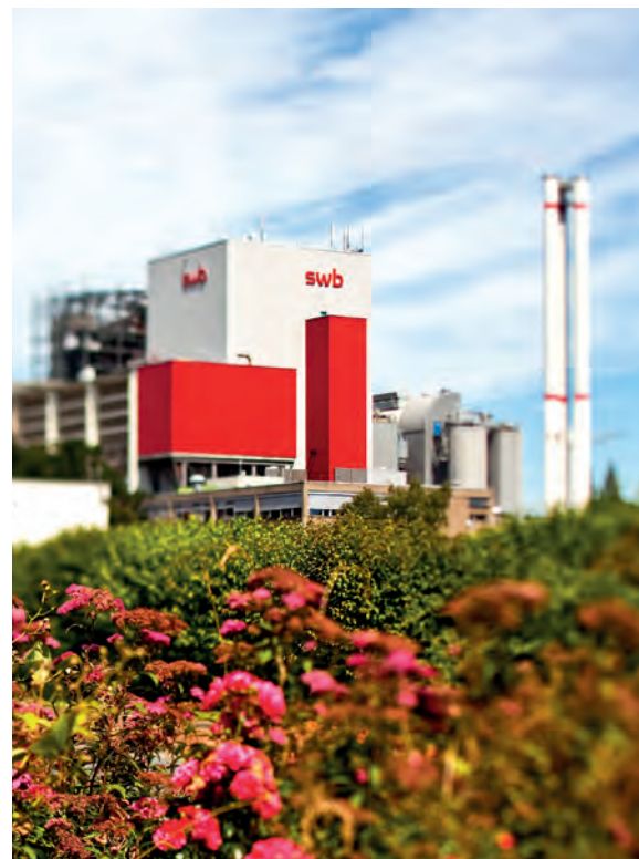
Das MHKW Bremen erzeugt Ökostrom für Geschäftskundenprodukte von swb.